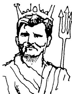
Poseidón – vládce moří