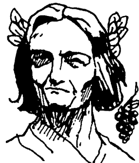
Dionýsos – bůh vína

"Proto," řekla opice a šla důstojně dál.