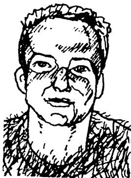
Minotaurus – poločlověk střežící labyrint

Rozdány vedoucím oddílů; do podzimu odstranit nedostatky. Na konci září bude provedena další kontrola průkazek a evidence členů (doplnění nových údajů).