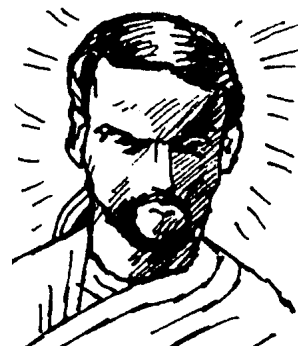
Apolón – bůh slunce