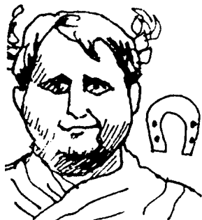
Hefajstos – boží kovář