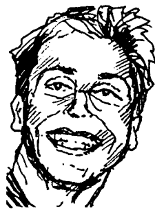
Hádés – vládce podsvětí