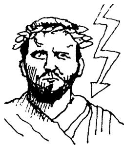
Zeus – vládce bohů

Jako technické, administrativní a propagační vozidlo velice dobře při akci posloužila Štěpánková škodovka.