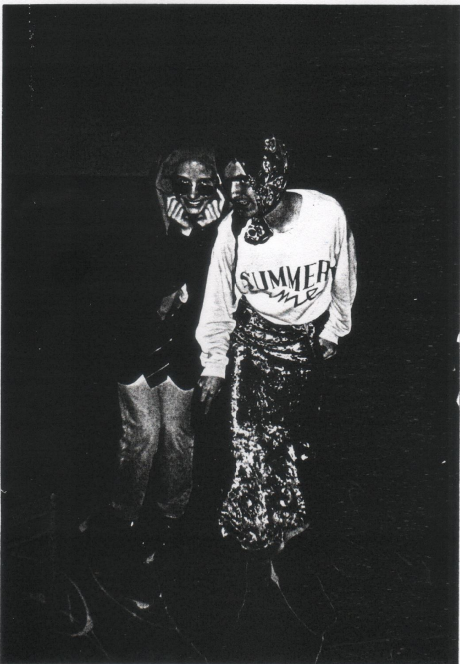
Výše uvedené fotografie dokreslují atmosféru akce Helvikov. Bylo opravdu těžké vybrat z celé řady pěkných záběrů těch pár k otištění Ale nezoufejte všechny fotografie z této akce si budete moci prohlédnout na nové nástěnce..

Žihadlo se stalo díky svým reportážím, nekonvenčním názorům a pohledům "z druhé strany" nejčtenější částí Věstníku. Dá se říct, že Žihadlo tak trochu přerostlo Věstníku přes